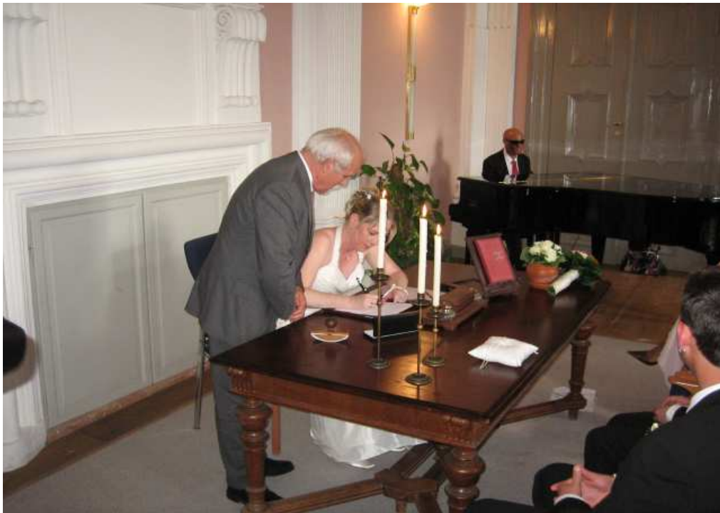
Die Niederschrift zur Eheschließung wird mit einem Füller der Marke „MONT BLANC- Meisterklasse“ unterschrieben.