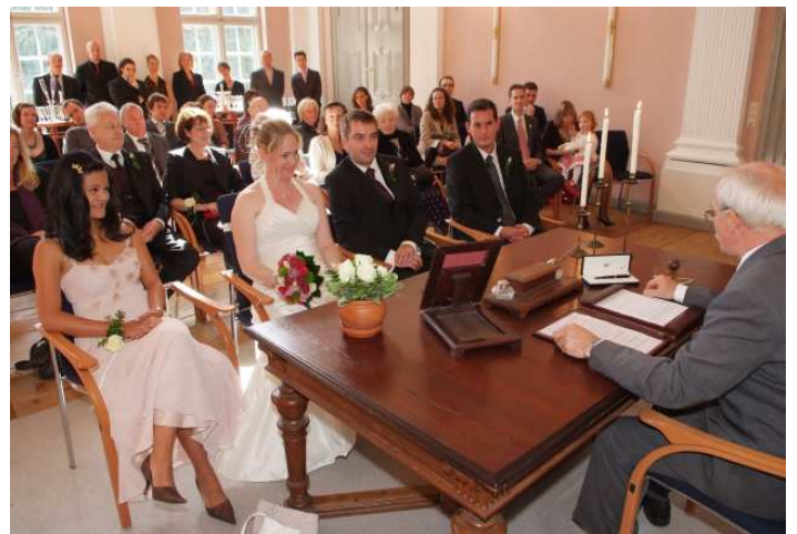
Fotografieren ist während der Trauung möglich.