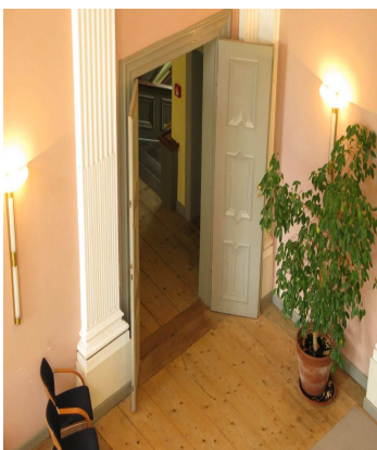
Eingangstür ins Trauzimmer