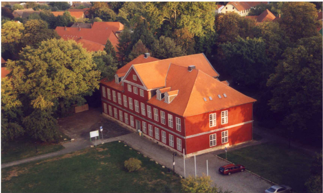
Ansicht aus Nord/West

Nach dem Umbau des Hauses wurde es im Juni 1996 Sitz der Verwaltung der Samtgemeinde Sickte und seitdem zählt das Herrenhaus Sickte zu den beliebtesten Standesämtern in der Region. Inzwischen gaben sich 1335 (Stand 31.12.2009) Paare und 2 Lebenspartnerschaften aus nah und fern hier in Sickte ihr Ja-Wort.